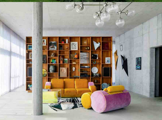
Berlínský dům, ve kterém je zároveň Anselmovo studio, vznikl podle návrhu jeho manželky Tanji Lincke