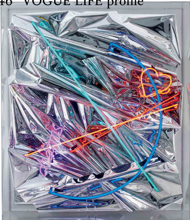
Bez názvu, 2022