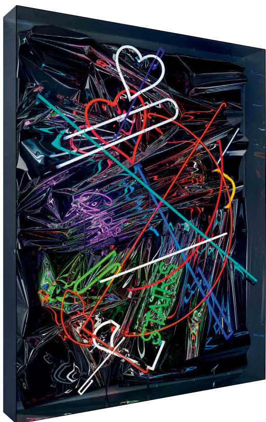
Bez názvu, 2022